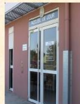
FONDATION PERE FAVRON

EHPAD de Bois d'Olives 4 bis, chemin Palma 97 410 Saint Pierre ☎ : 0262 91 77 51 Fax : 0262 91 73 08